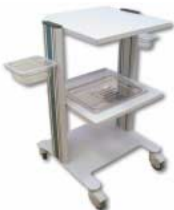
CARRELLO PORTASTRUMENTI TROLLEY