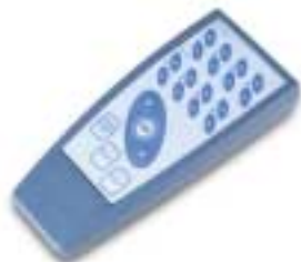
TELECOMANDO REMOTE CONTROL