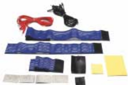
ESEMPIO ACCESSORI ACCESSORIES EXAMPLE